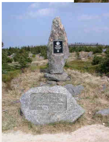
Grüss von der Tafelfichte (1122 mt. ü. d. M.)