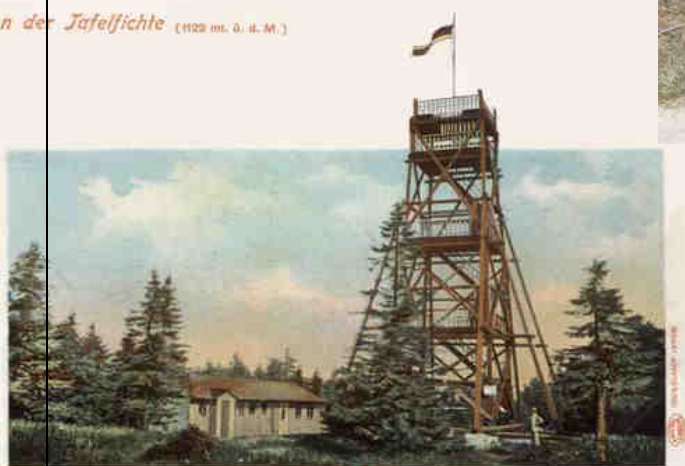
Turm am Intr. hoch mit Gastwirtschaft.